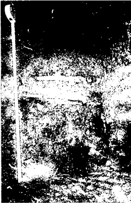
Figura 2. Els Ametllers. Tomba núm. 1.

A la part rústica de la vil·la es van identificar un seguit de tombes que no analitzarem en considerar que pertanyen a un moment molt més avançat de la història de Turissa , quan l'edifici dels Ametllers, havia deixat de ser una gran vil·la romana (Zucchitello, 1998, 147-155).