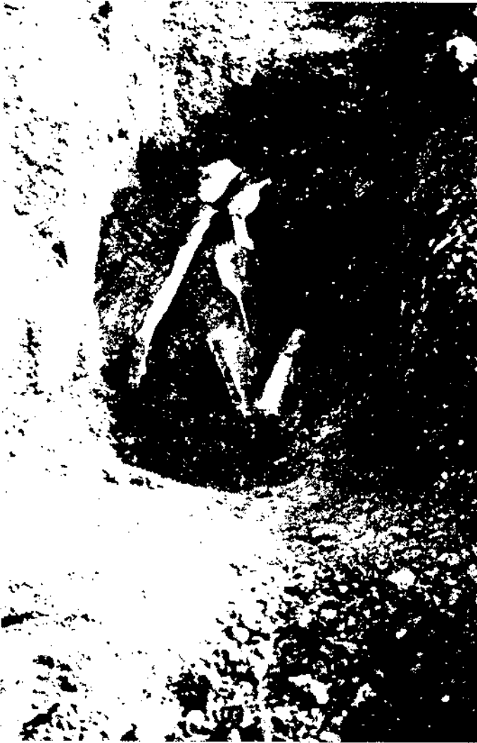
Figura 2. Pla de l'Horta. Tomba.

identificar i explorar una tomba romana. Era feta amb dues teules planes posades dretes conformant una coberta a doble vessant que cobria les despulles d'un infant molt petit, posat decúbit supí, amb la testa a ponent i els peus a llevant. Malgrat la protecció, les restes òssies es trobaven molt malmeses, per causa de l'edat del difunt i de la humitat del lloc. Havia estat sebollit amb un antoninià de l'emperador Dioclecià posat molt probablement a la boca, que permet proposar un terminus post quem de vers el 300 (Palahí, 1998, 204-208) (fig. 2).