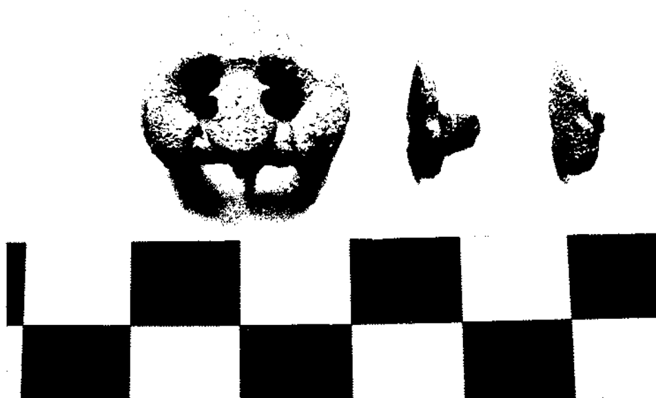
Figura 9. La sivella i els aplics de l'enterrament 18.