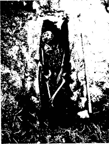
Figura 2. Enterrament 1.