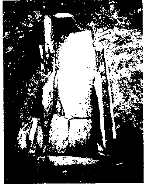
Figura 5. Enterrament 15.