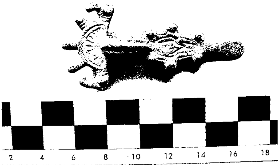
Figura 8. La fibula de bronze apareguda a l'enterrament 17.