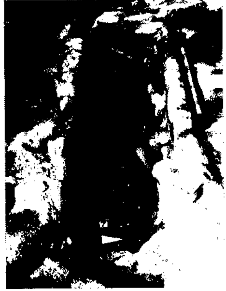
Figura 3. Enterrament 7 (esquelet inferior).