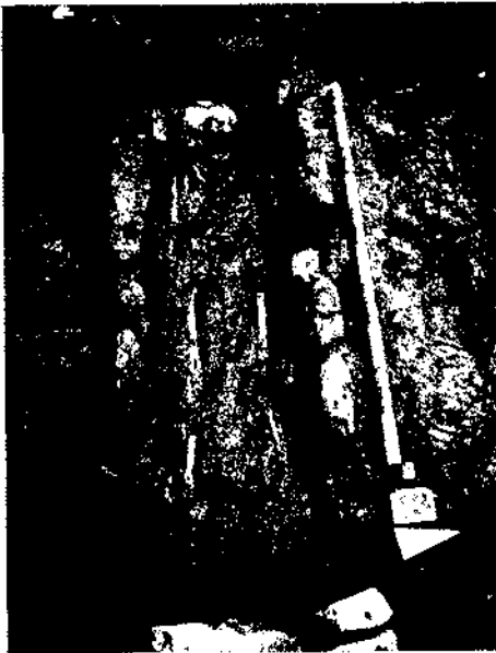
Figura 4. Enterrament 13.