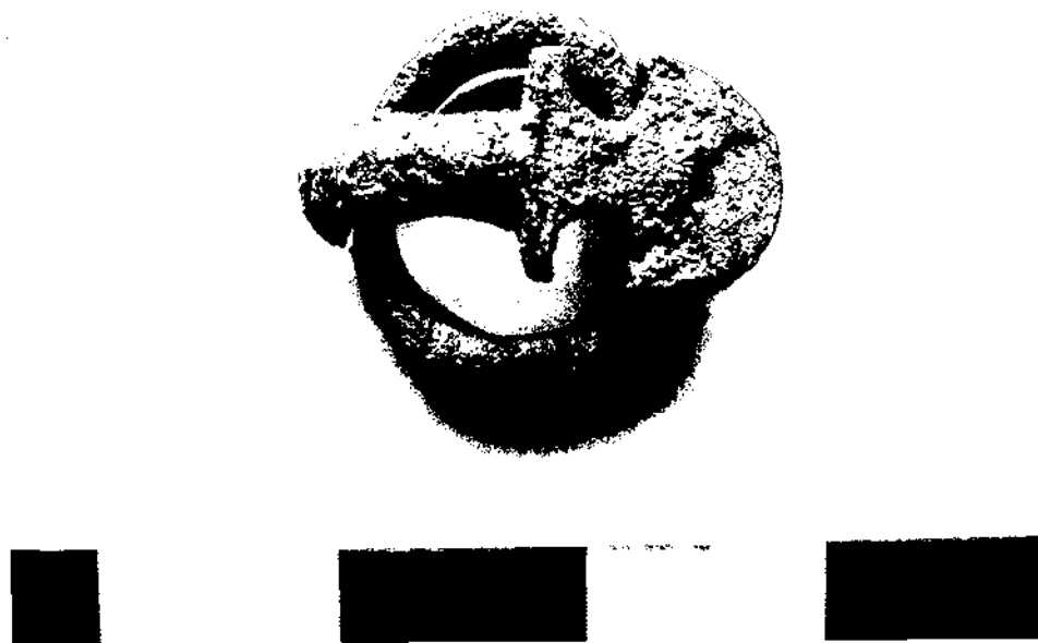
Figura 10. La sivella apareguda a l'enterrament 19.