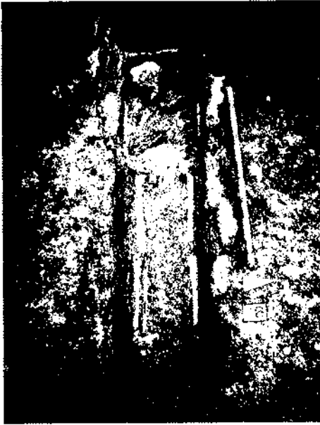
Figura 6. Enterrament 18.