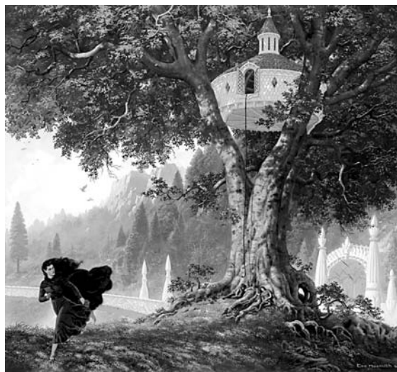
Lúthien fuig de la presó on l'ha tancada el seu pare i va a auxiliar el seu enamorat, Beren.

Però la història de Lúthien i Beren multiplica els estímuls i s'hibrida amb la rondalla d'Amor i Psique i amb la història d'Orfeu —el Sir Orfeo situa aquesta darrera al cor de les lletres angleses de la baixa Edat Mitjana—, 7 per donar lloc a un nou mite: el de la parella d' enamorats heroics que, a través del socors mutu, aconsegueixen de rescatar un tresor extraordinari, una mica també a la manera de Walter i Hildegunda al poema llatí Waltharius (segles IX-X), escrit a partir de relats orals germànics. 8 El pare de Lúthien, per desanimar Beren, li proposa que li porti, com a regal de casament, un dels silmarils, els joiells màgics que pesen sobre el destí dels elfs. El jove desafia, a