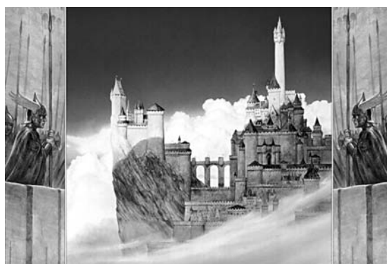
Vista de la ciutat de Minas Tirith, capital del regne de Gondor.

«No sou pas gasiu, Éomen» va dir Aragorn, «cedint així a Gondor, la cosa més bella del vostre reialme!» Aleshores Éowyn va mirar Aragorn al ulls, i va dir: «Desitjeu-me felicitat, senyor i guardor meu!» I ell va contestar: «Us vaig desitjar felicitat des del primer moment en què us vaig veure. La benedicció que avui veig en vós dona consol al meu cor» ( LOTR , 3: 225).