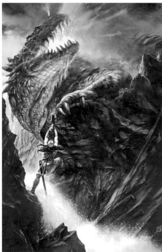
L'heroi maleït Turin mata el drac Glaurung, segons el relat d' El Silmaril·lion .