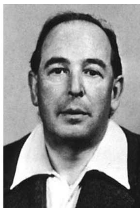
C. S. Lewis, membre dels Inklings.

condició femenina: i és que la dona és fada benigna i àngel protector, però també potencial mare de família.