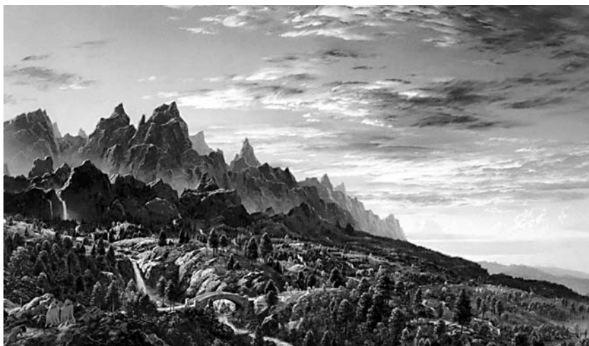
Els boscos d'Ithilien, on Frodo va trobar Faramir.

per venjar o salvar Theoden» ( HOME , VII: 448). Tolkien encara no havia acabat de triar el nom del germà d'Éowyn i fer-la morir en combat li semblava una solució acceptable per al problema del seu amor per Aragorn, que havia esdevingut impossible.