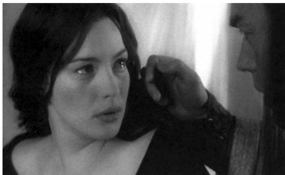
Arwen, l'esposa d'Aragorn, segons la pel·lícula de Peter Jackson.

temps. 2 En qualsevol cas, Jackson va filmar dues seqüències, pràcticament sense paraules, en què Faramir i Éowyn, convalescents de les respectives ferides, es miren, s'agafen de la mà i s'abracen. Ens hem perdut el treballat diàleg sentimental-terapèutic de Tolkien, però almenys se'ns diu què passa. I no se sap per quins set sous no hi ha petó: l'únic petó de tot El senyor dels anells , un petó amorós, atorgat «davant de la mirada de molts» ( LOTR , 3: 214). És per això de «la mirada de molts» que els guionistes l'han desplaçat a l'escena ja esmentada de la coronació, fent que Aragorn, en un final enutjosament tòpic, besí apassionadament Arwen en públic quan aquesta apareix per sorpresa amb la comitiva dels elfs? 3