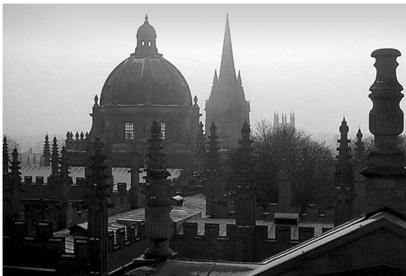
Panorama del centre històric d'Oxford.

L'atracció eròtica no encaminada a un matrimoni fecund és un fenomen aliè al món mític i heroic d' El hobbit i d' El senyor dels anells , i ho és de forma deliberada i conscient. Només cal pensar que les figures més populars, com Bilbo i Frodo Baggins, oncle i nebot, són solters i no se'ls coneix cap relació femenina. El polifacètic i entranyable Gandalf, des d'aquest punt vista, presenta un perfil sacerdotal, com si l'orde dels mags, al qual també pertany Saruman, imposés el celibat. 5 Si considerem la gènesi de les dues obres de ficció, l'asexualitat dels protagonistes té alguna cosa a veure amb el fet que Tolkien va començar a escriure per a un públic juvenil. 6 En canvi, els materials mitològics i heroics d' El Silmaril·lion contenen algunes històries passionals força tènues. El fet és que des del moment que els hobbits d' El senyor dels anells entren en contacte amb Strider-Aragorn, Tolkien va trobar-se a les mans una trama amorosa, especialment quan va «descobrir» que el misteriós personatge que coneixem a l'hostal de Brie era l'hereu d'Isildur —el rei que uns