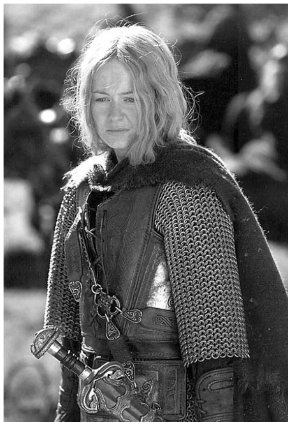
La donzella guerrera Éowyn, que s'acaba casant amb Faramir, sensecal de Gondor.

de Rohan, quan Gandalf desfà l'encanteri que el mantenia sotmès a la voluntat del Grima, l'agent de Saruman, el traïdor. Oncle i neboda surten a la llum del sol i Aragorn la veu: bonica, alta i prima, majestuosament vestida de blanc i d'argent, amb els cabells com un riu d'or. La impressió que li fa és d'una noia freda i dura, gairebé un infant. I aleshores ella se'l mira a ell: alt, d'estirp reial, savi, carregat d'anys i portador d'un poder ocult ( LOTR , 2: 104). Sabem que ella s'enamora perdudament i ell no; el text ho suggereix, però com que la presència femenina és tan escassa a El senyor dels anells i, com que quan hem vist Arwen, la seva mirada perfora el cor de Frodo i no pas el d'Aragorn, que està conversant tranquil·lament al seu costat (vegeu el punt b del quadre anterior; citat més amunt, a LOTR , 1: 228), el lector té tot el dret de dubtar. I continua despitant el fugisser contacte de mans entre Éowyn i Aragorn. Som de nou a Meduseld, i Éowyn, com la reina Walto del Beowulf , honora els guerrers un per un fentlos beure de la mateixa copa on ha begut el rei, que ha recuperat el pòndol del govern ( LOTR , 2: 111). Per