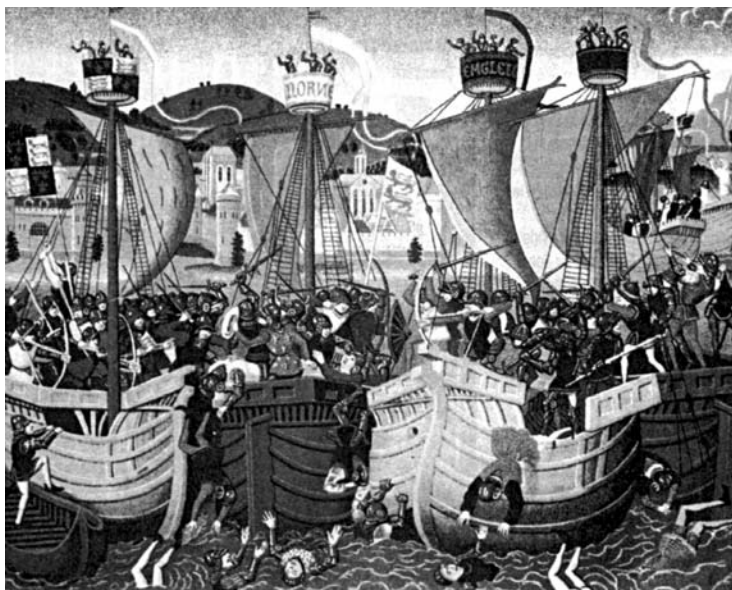
Combat naval (Cambridge, Fitzwilliam Museum).