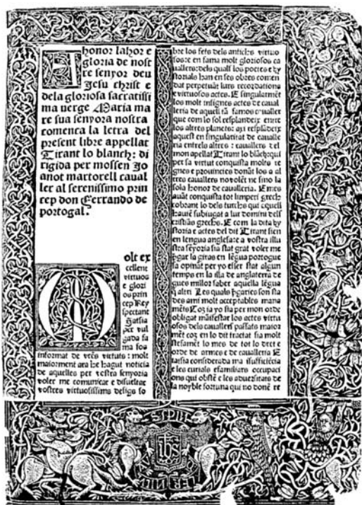
Portada de la primera edició del Tirant (València, Nicolau Spindeler, 1490).

En els capítols 98-100 del Tirant lo Blanc se'ns explica el setge de Rodes pel soldà d'Alcaire. Aquest en poc temps s'ha emparat de tota l'illa de Rodes, exceptuant la ciutat, a la qual ha posat setge, mentre l'estol, situat al port, impedeix l'auxili i el proveïment dels assetjats. Per ordre del mestre de Rodes uns quants mariners han burlat el bloqueig i han partit vers les corts del papa, de l'emperador i dels reis cristians en sol·licitud d'auxili. Tirant lo Blanc, veient que no es troba qui socorri Rodes, es posa d'acord amb uns mariners i emprèn ell mateix el fet. Quan Tirant de camí cap a Rodes s'atura uns dies a Sicília, arriba a Palerm una nau portant noves de la difícil situació dels assetjats de Rodes, els quals, sense eixida ni proveïments, estan a punt de lliurar-se a l'enemic: