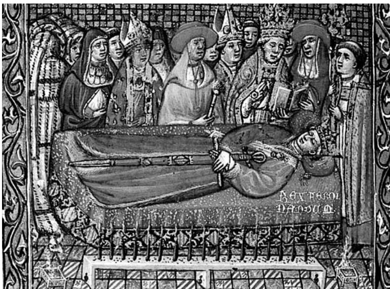
Ferran d'Aragó al llit de mort (Llibre d'hores d'Alfons el Magnànim, Londres, British Library).

a les costes d'Itàlia, i una de les places del domini dels genovesos. Animat per aquest precoç i feliç èxit, i després de deixar a Calvi una forta guàrdia, anà amb l'esquadra sobre la ciutat de Bonifacio, posada enfront de l'Àfrica, que és una altra plaça dels genovesos, amb l'esperança d'aconseguir el mateix triomf.