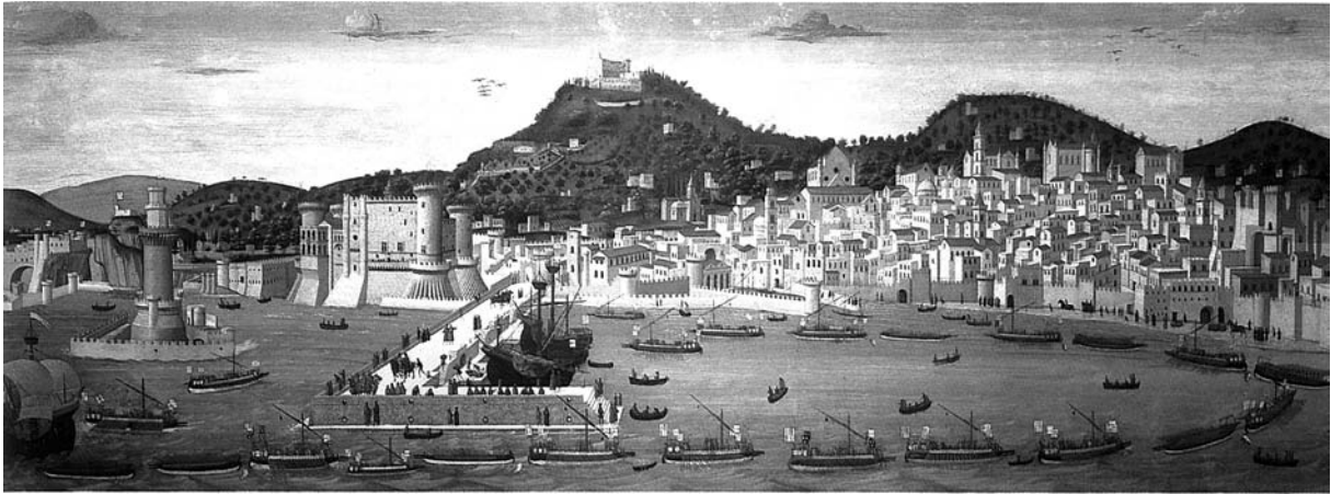
La Tavola Strozzi retrata un altre port on va actuar l'armada del Magnànim, el de Nàpols (Nàpols, Museo Nazionale di San Martino)

dors e de molts cops de bombardes e de tot lo que en la mar s'usa. E Tirant manà al timoner e al nauxer que no voltassen la nau, sinó que donassen la proa en terra en dret de la ciutat en un arenal que hi ha pegat a la muralla. E a veles plenes donaren allí (cap. 104, Riquer 1979: 320-321).