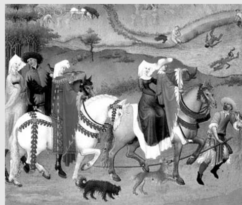
El duc de Berry surt a caçar amb falcons ( Très riches heures de Jean de Berry (Chantilly, Musée Condé).