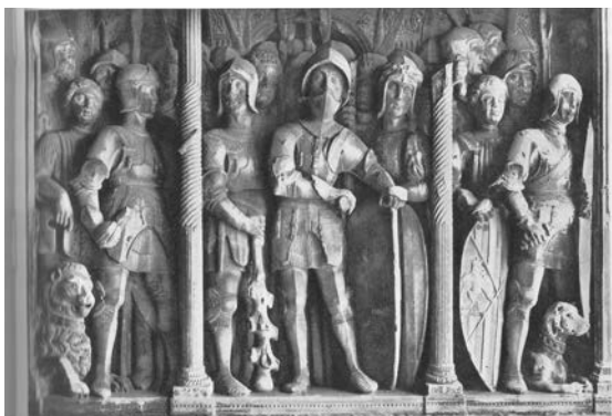
Cavallers a l'Arc Triomfal d'Alfons el Magnànim al Castell Nou de Nàpols, Francesco Laurana, 1453.