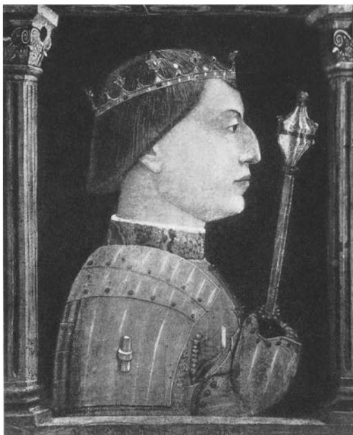
Retrat d'Alfons el Magnànim. Seguidor de Piero della Francesca, c. 1440-50. (París, Museu Jacquemart André).

ment greus per a Catalunya, ja que després del 1423 el rei fixarà la residència a València. Aquesta situació va permetre a la noblesa de prendre's tota mena de llibertats sense cap reacció per part del poder; tot i els intents de la lloctinent Maria de Castella, testimoniats per infinitat de memorials sobre els greuges comesos que trametia al seu marit per tal que apliqués els càstigs i les multes necessàries. Però el poder era massa lluny i les resolucions eren massa lentes per canviar actituds que venien de lluny i que, sobretot, tenien un marc legal on sustentat-se.