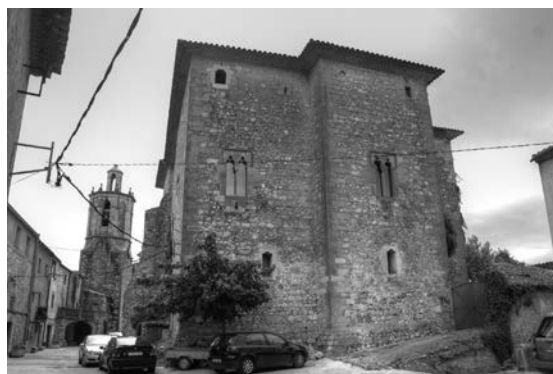
Castell de Sant Mori.

Aquesta cessió de l'herència mostra que els Rocabertí eren una família cohesionada i ben