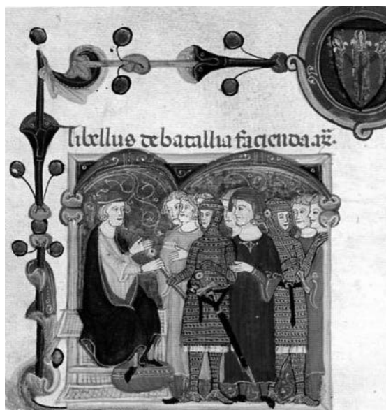
Íncipit del Llibre de batallia facienda , sobre el duel judicial, segle XIV.