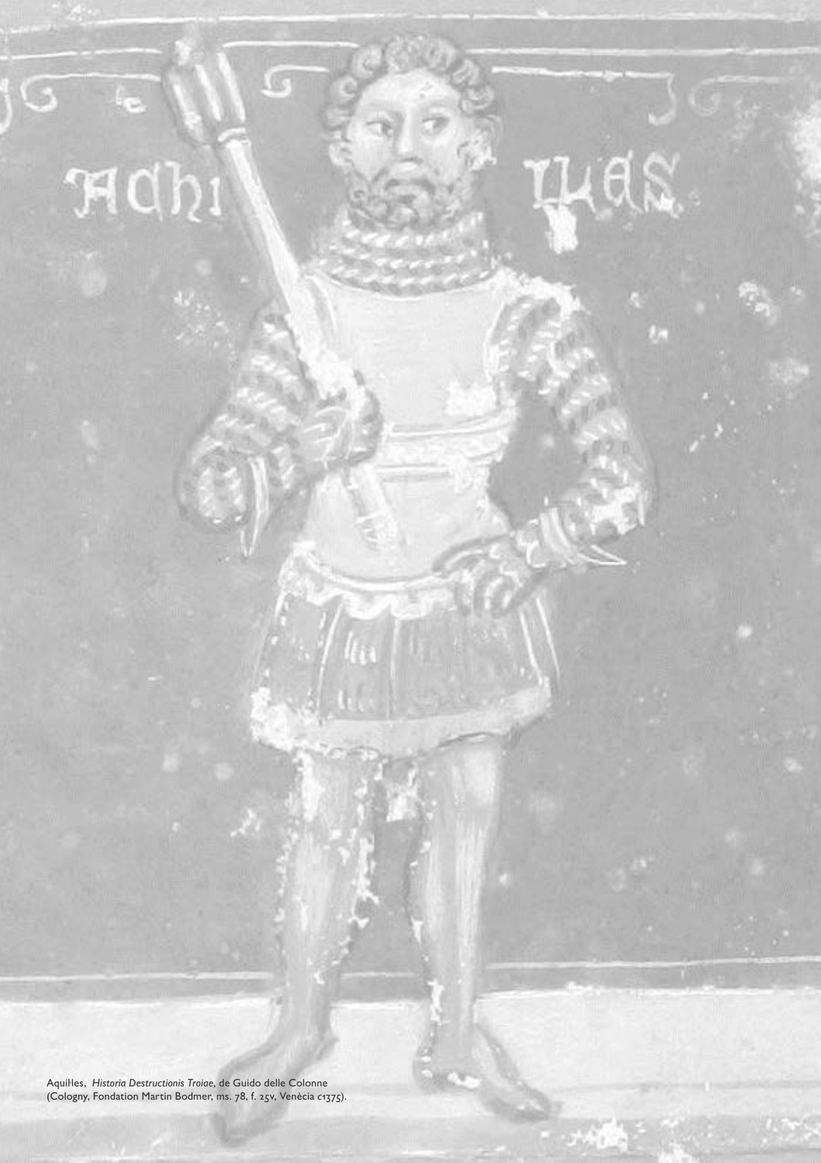
Achilles, Historia Destructionis Troiae , de Guido delle Colonne (Cologne, Fondation Martin Bodmer, ms. 78, f. 25v, Venècia c1375).