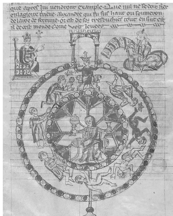
Aristòtil representat a l'oriental sobre la roda de la Fortuna (Estocolm, Kungliga Biblioteket, ms. V.u.20).