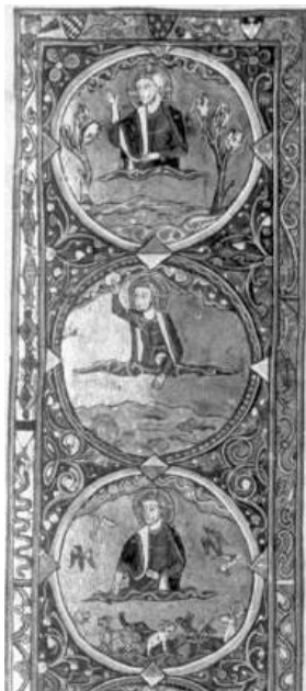
Escena de la creació, atribuïda al Maître de l'Hospitalier. Histoire ancienne jusqu'à César , detall (París, BnF, fr. 20125, f. 3r).

dels Lusignan jugués un paper de primer ordre a Terra Santa i a Xipre.