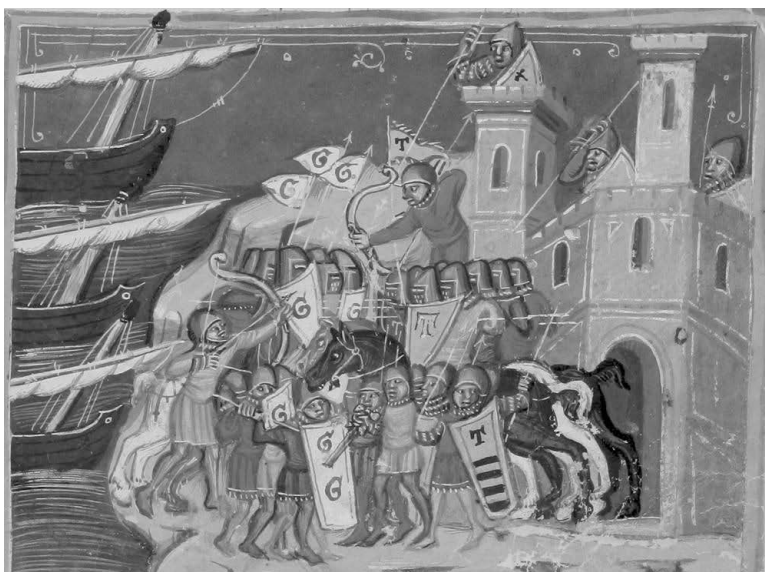
Fragment d'una miniatura de la Historia Destructionis Troiae , de Guido delle Colonne (Cologne, Fondation Martin Bodmer, ms. 78, f. 39r, Venècia c1375).