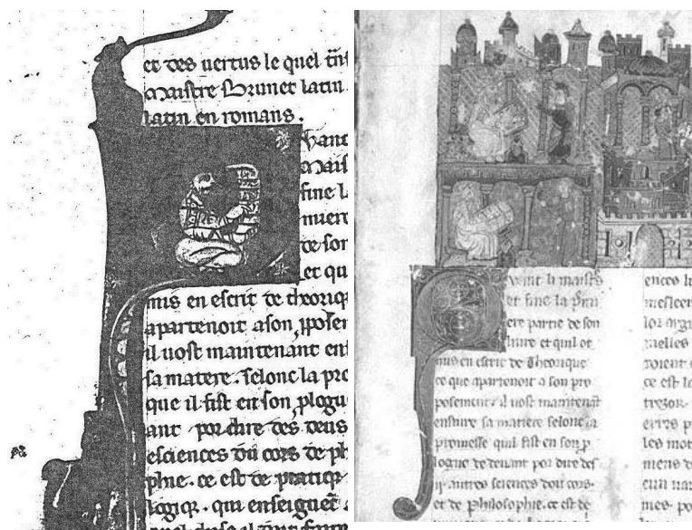
Els manuscrits del Tresor de Londres (es) i Carpentràs (dr) presenten una gran semblança en la decoració.

a gairebé totes les llengües de l'occident medieval. Se'n coneixen també algunes versions en català (Zamuner 2005a: 66–75, Zamuner 2005b; Cifuentes 2006: 174–76). Al manuscrit d'Estocolm, a banda del Secret , s'hi ha inserit a la història d'Alexandre dos passatges del Tresor (els capítols del bestiar de peixos, i la part de la geografia d'Europa) segons un text que presenta moltes semblances amb el text dels testimonis considerats fins ara (Zinelli 2007: 67–69). Pel que fa a la decoració, tornem a trobar fons exòtics a les miniatures del manuscrit i, sobretot, torna a aparèixer el personatge d'Aristòtil amb el turbant, assegut a l'oriental, en l'acte d'escriure en un pergami amb caràcters