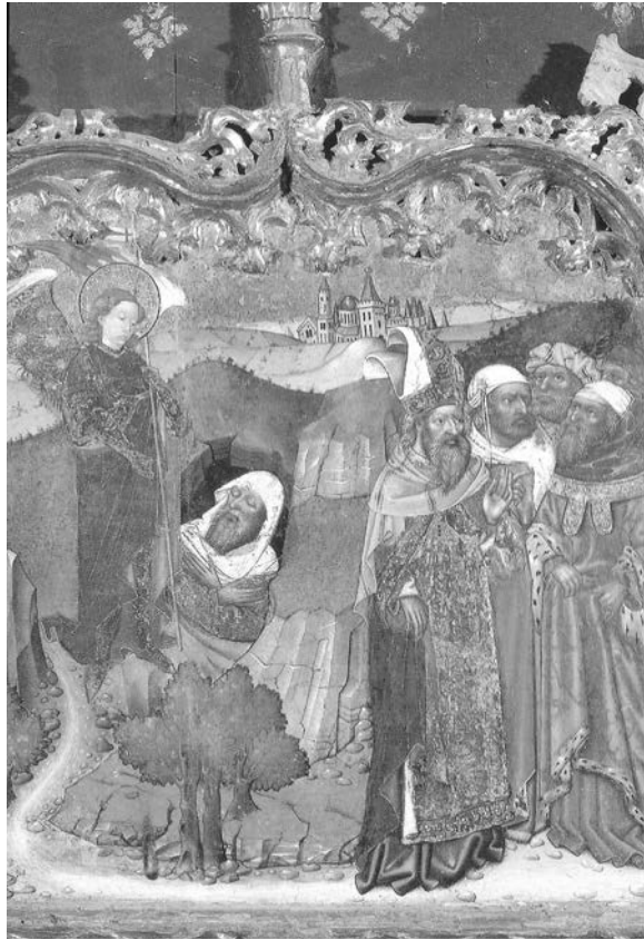
Grup de jueus notables castellanins ben vestits i amb cara de preocupació al costat de l'arcàngel Miquel, vetllant el cos exànim de Moisès. Retaule de st. Miquel a Castelló d'Empúries, obra de Joan Antigó, Honorat Borrassà i Francesc Vergós (Girona, Museu d'Art, segle XV).

creaven els jueus de diversos nuclis urbans. Malgrat que la mobilitat responia a criteris diversos, sobretot depenia de les activitats econòmiques, les relacions socials i la preponderància política a l'interior de les comunitats jueves existents.