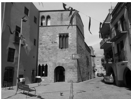
Museu d'Història Medieval de la Cúria-Presó de Castelló d'Empúries, segle XIV (en endavant, MHMCE). Doble edifici construït per ordre del comte d'Empúries l'Infant d'Aragó Pere I a partir de l'any 1336 al puig Mercadal, amb restes arquitectòniques de l'antic castell comtal.

La importància de Castelló d'Empúries com una de les poblacions més rellevants del nord-est català a finals de l'Edat Mitjana, probablement només superada per Girona i Perpinyà, va esdevenir cada vegada més clara per als historiadors. Els darrers estudis hi evidencien la conformació d'un nucli molt actiu des del punt de vista econòmic i comercial, amb un poblament bastant superior al sostre proper als 3.000 habitants que tradicionalment s'havia suposat. En el present article, que pren el nom d'una de les conferències realitzades a Castelló d'Empúries el mes de setembre del 2015 en el marc del Festival Terra