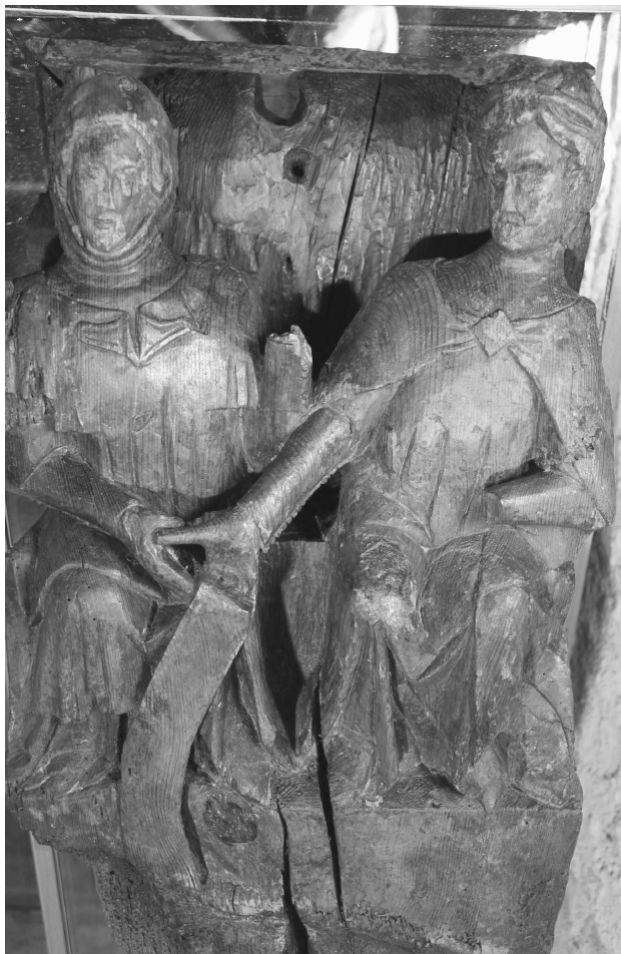
Mènula de fusta amb la imatge dels comtes d'Empúries l'Infant Pere I (dreta) i Joana de Foix (esquerra), tallada en pi i procedent de l'edifici de la Cúria comtal, la cort de justícia de Castelló d'Empúries i del comtat d'Empúries, segle XIV, ca 1336 (MHMCE).

Quant a les residències castellanines dels comtes d'Empúries a la baixa Edat Mitjana, cal parlar en primer lloc del castell del puig Mercadal. Situat a l'actual plaça Jaume I i a les illes de cases adjacents, va ser una de les residències més habituals dels comtes entre principis del segon mil·lenni i el primer terç del segle XIV. Fou desmantellat pels volts del 1332, uns set anys després que el comtat hagués anat a parar a mans de Pere I. Llavors es va parcel·lar la superfície que havia ocupat i es van cedir una bona part de les finques resultants a diversos paraires locals, per tal que hi instal·lessin els seus obradors de producció i venda de teixits. Els primers terrenys cedits foren 24 solars de 3 canes d'ample i 4 més de llargada (és a dir, 4,8