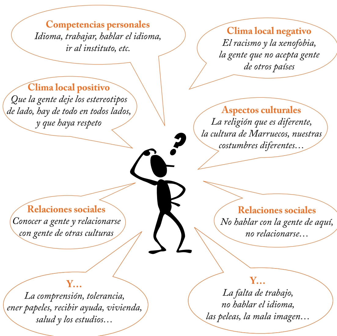
Figura 1: Factores para la integración magrebí desde su propia perspectiva

Se apunta a una doble dirección en la causalidad de su integración: su esfuerzo (competencias) y el esfuerzo del resto (de los nacionales en aceptarlos). En esta ocasión, la opinión del alumnado de origen magrebí estaría en la línea de la definición de integración que defendemos que se entiende como proceso dinámico entre dos partes. El siguiente